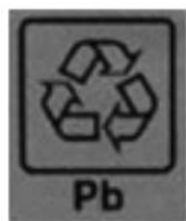
图3 铅酸蓄电池的回收标志