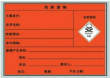
图 2 危险废物标签

4.1.5 收集、贮存、运输、转移废电池的装置应根据废电池的特性而设计,具有不易破损、变形、绝缘,能有效防止渗漏、扩散,并耐酸腐蚀特性;装有废电池的装置应按照 GB 18597 的要求粘贴危险废物标签(见图 2),禁止在收集、贮存、运输、转移过程中擅自倾倒电解液,拆解、破碎、丢弃废电池。